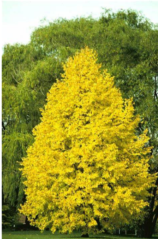
Couleurs en automne