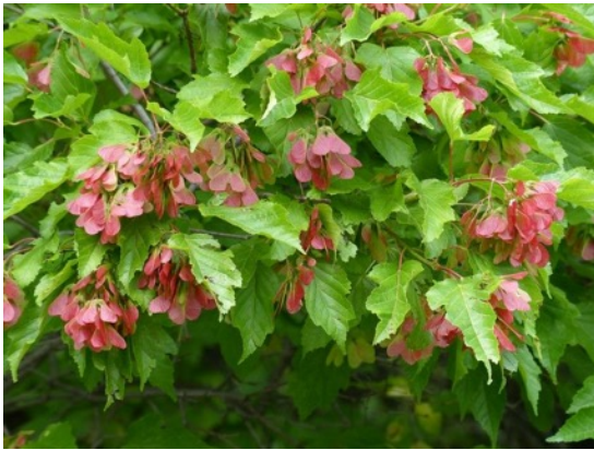
Floraison au printemps