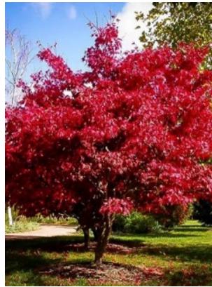
Couleurs en automne