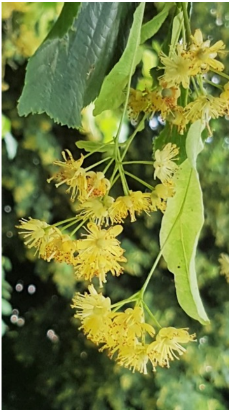
Floraison au printemps