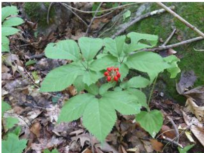
Ginseng à cinq folioles

Le conférencier présentera les étapes de son projet agroforestier : de l'établissement d'une plantation de chênes et d'érables en passant par l'entretien annuel de plantation jusqu'à la mise en culture de plantes d'ombre telles le ginseng à cinq folioles, l'hydraste du Canada, la sanguinaire, l'actée noire, l'asaret du Canada, le petit-prêcheur... et l'ail des bois qui fera l'objet d'une attention spéciale.