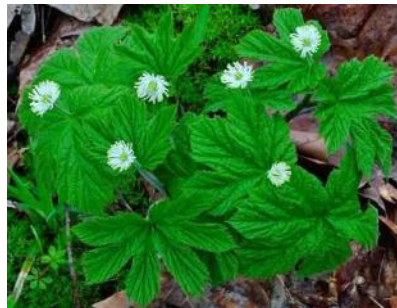
Hydraste du Canada