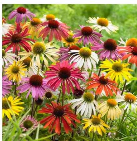
Chrysanthèmes d'automne (Mums)